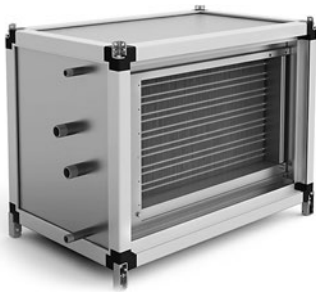
Водяной нагреватель SPH-W